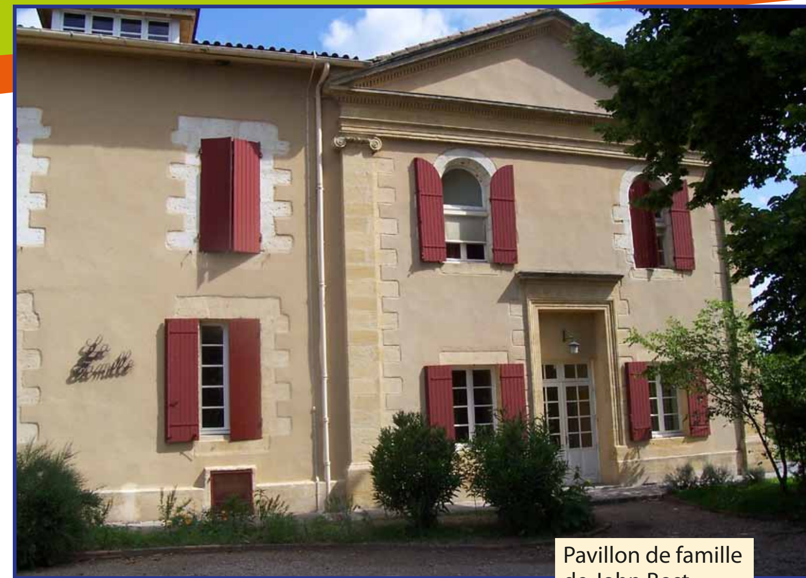
Pavillon de famille de John Bost.

En 1881 John Bost est à Paris pour s'occuper des intérêts des Asiles lorsqu'il est frappé d'une congestion pulmonaire. Il sera inhumé au petit cimetière protestant des Alains.