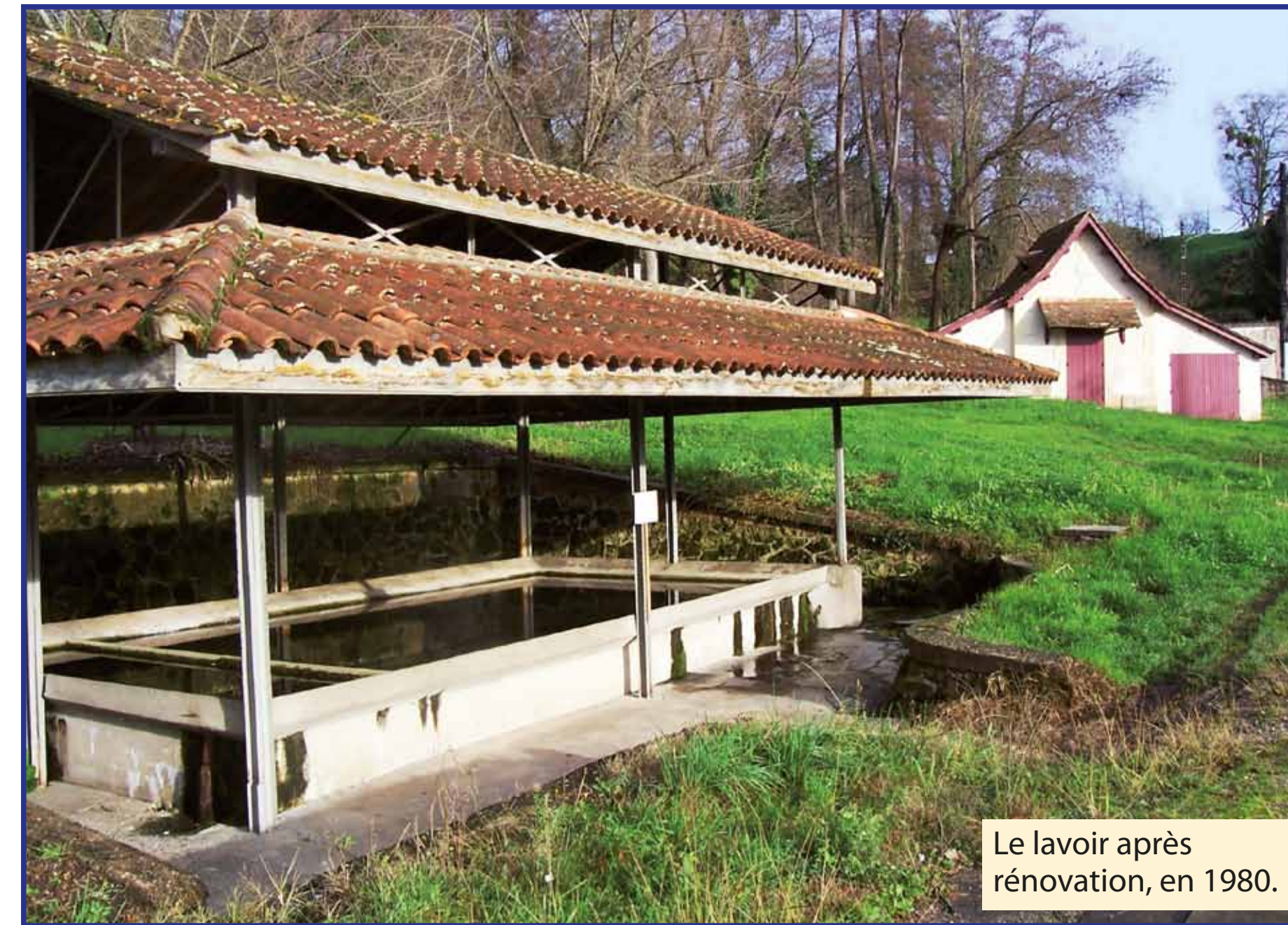
Le lavoir après rénovation, en 1980.